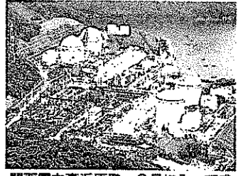
関西電力高浜原発。8月に入って感染者が相次ぎ、クラスターも起きた。6月20日、福井県高浜町、朝日放送テレビヘリから、矢木隆博撮影

新型コロナウイルスの「第6波」の中、各地の原発でも感染者が増えている。放射性物質を扱う原発は施設が密閉されており、多くの作業員が集まる。各電力会社は「原発特有の要因ではない」とするが、工事や定期検査が止まって運転状況に影響が及ぶケースもある。