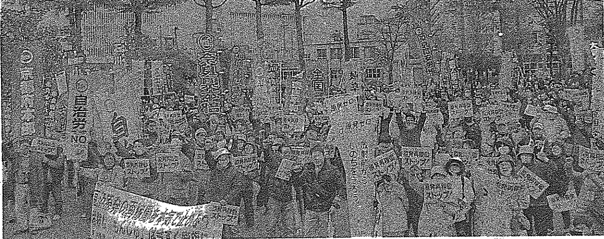
再稼働反対のシュプレヒコールを上げる参加者ら=5日、福井市

「高浜原発3、4号機の再稼働を本気で止める！全国集会」が5日、立地県である福井県の福井市西公園で開催され、県内外から約1200人が参加しました。「原発再稼働ストップ」のプラカードを一言に掲げ、パレードでアピールしました。