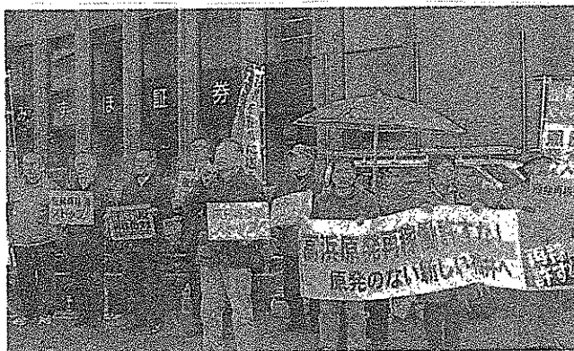
抗議の声を上げる参加者ら＝22日、福井市