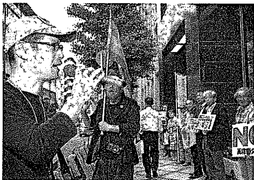
関西電力に対して抗議の声を上げる市民ら17日、京都市